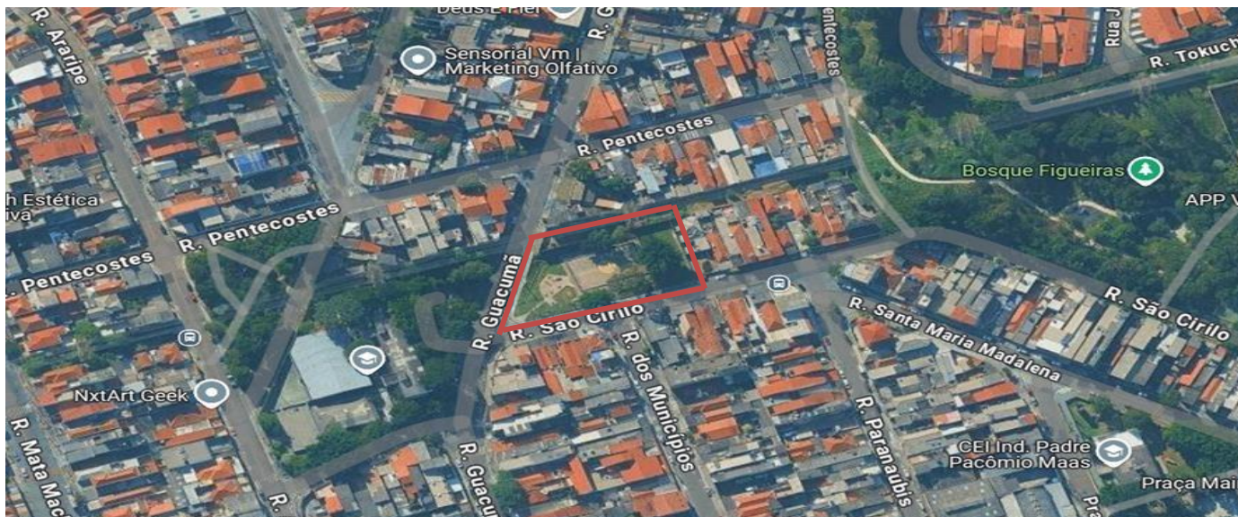
Figura 1 – Área da intervenção